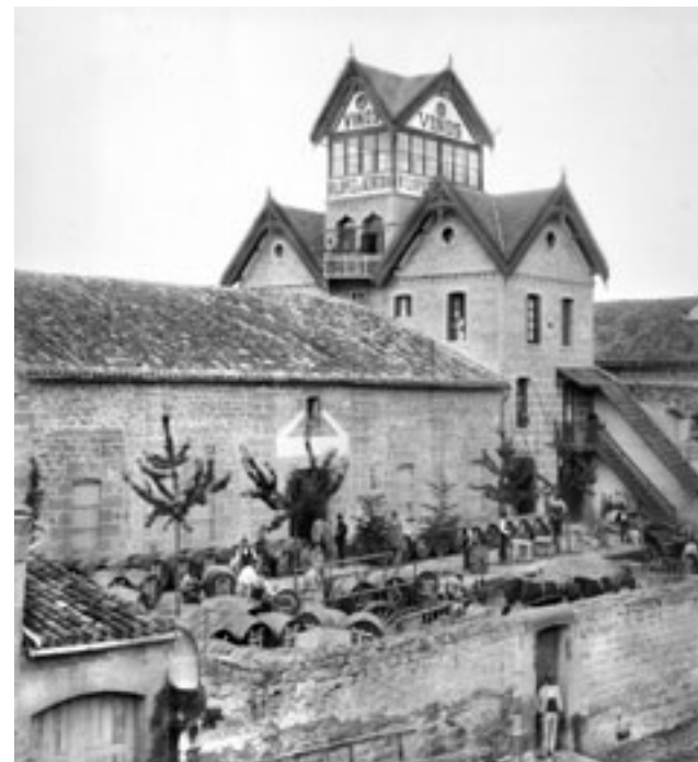
Trabajadores y familia posando en la fachada de la bodega. 1887

A este proyecto también se han sumado las imágenes de archivos públicos y privados, así como fotógrafos y empresas que conscientes de la magnitud de esta impresionante base de datos han cedido sus reproducciones para complementar la documentación ofrecida por la fotografía popular.