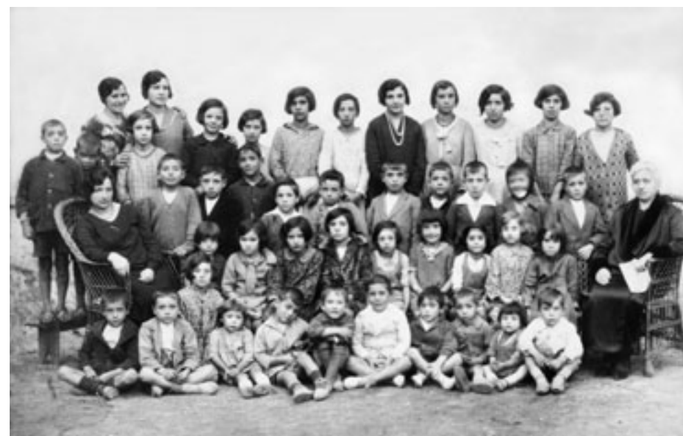
Maestros y alumnos de Santa Eulalia Bajera. 1928